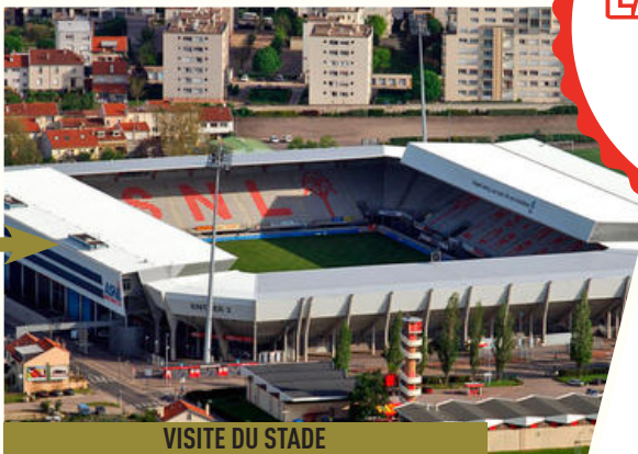
VISITE DU STADE